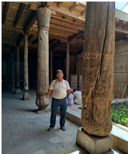
4-rasm: Juma masjidi yog'och ustunlari va o'ymakorlik namunasi

4-rasmda yog'och ustunlarning bezak va konstruksiya sifatida bir vaqtda ishlashi ko'rinadi. Xiva ustalari yog'ochga faqat naqsh tushirmagan, balki ustunning og'irlik ko'tarish vazifasini ham badiiy ko'rinishga aylantirgan. Bu yerda me'morlik va amaliy san'at bir-biridan ajralmaydi: ustun binoni ko'taradi, naqsh esa makonning ruhini belgilaydi. O'zbek yog'och o'ymakorligi bo'yicha tadqiqotlar ham bunday bezaklarda tarixiy ildiz, estetik mezon va ijtimoiy vazifa birga yashashini ko'rsatadi [12] .