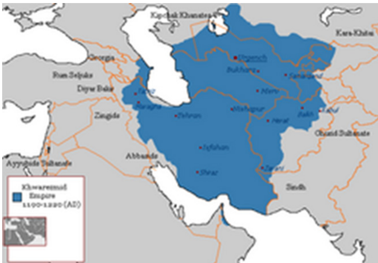
2-rasm: Xorazm vohasining tarixiy-geografik joylashuvi

2-rasmda Xorazm hududining yirik voha sifatidagi o'рни ko'rsatilgan. Bu joylashuv Xivaning savdo yo'llari bilan bog'lanishiga, shu bilan birga, sahro sharoitiga mos mustahkam shahar muhitini shakllantirishiga sabab bo'lgan. Xivaning Buyuk ipak yo'li yo'nalishlari bilan bog'liq shahar sifatida talqin qilinishi ham aynan shu geografik asos bilan izohlanadi. Demak, adabiyotlar tahlili Xiva mavzusini uch yo'nalishda - tarixiy manba, me'moriy shakl va pedagogik-estetik mazmun sifatida o'rganish zarurligini ko'rsatadi.