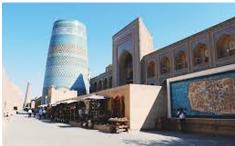
5-rasm: Muhammad Aminxon madrasasi va Kalta Minor majmuasi

Muhammad Aminxon madrasasi va Kalta Minor majmuasi Xivaning me'moriy siluetida alohida o'rin egallaydi. Muhammad Aminxon madrasasi XIX asr o'talarida bunyod etilgan yirik ta'lim muassasalaridan biri bo'lib, uning oldidagi Kalta Minor tugallanmay qolganiga qaramay, shaharning eng taniqli ramziga aylangan. Reja bo'yicha minora juda baland bo'lishi ko'zlangan, ammo qurilish to'xtab, u taxminan 29 metr balandlikda qolgan [4] . Shu holatning o'zi ham Xiva tarixidagi siyosiy va shaxsiy omillar me'moriy jarayonga qanday ta'sir ko'rsatishini anglatadi.