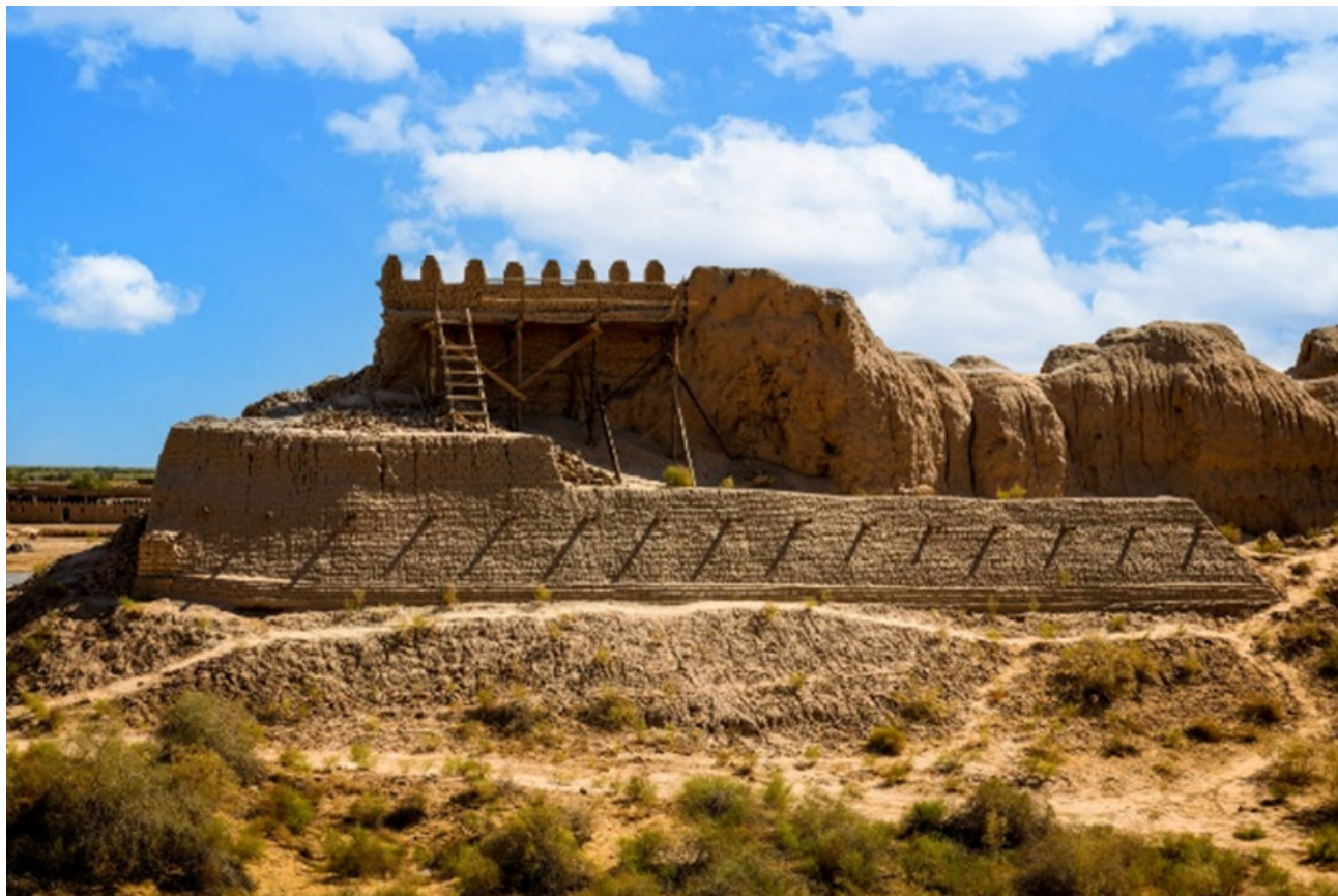
1-rasm: Xiva mudofaa devorlari va qadimiy shahar muhitining umumiy ko'rinishi

Xivaga oid ommaviy-ma'rifiy manbalarda ham shahar "ochiq osmon ostidagi muzey" sifatida talqin qilinadi. Mazkur ta'rif ilmiy matnda ehtiyotkorlik bilan qo'llanishi lozim bo'lsa-da, u Xiva me'moriy makonining yaxlit holda saqlanib qolganini ifodalash uchun qulay obraz sifatida xizmat qiladi [9] .