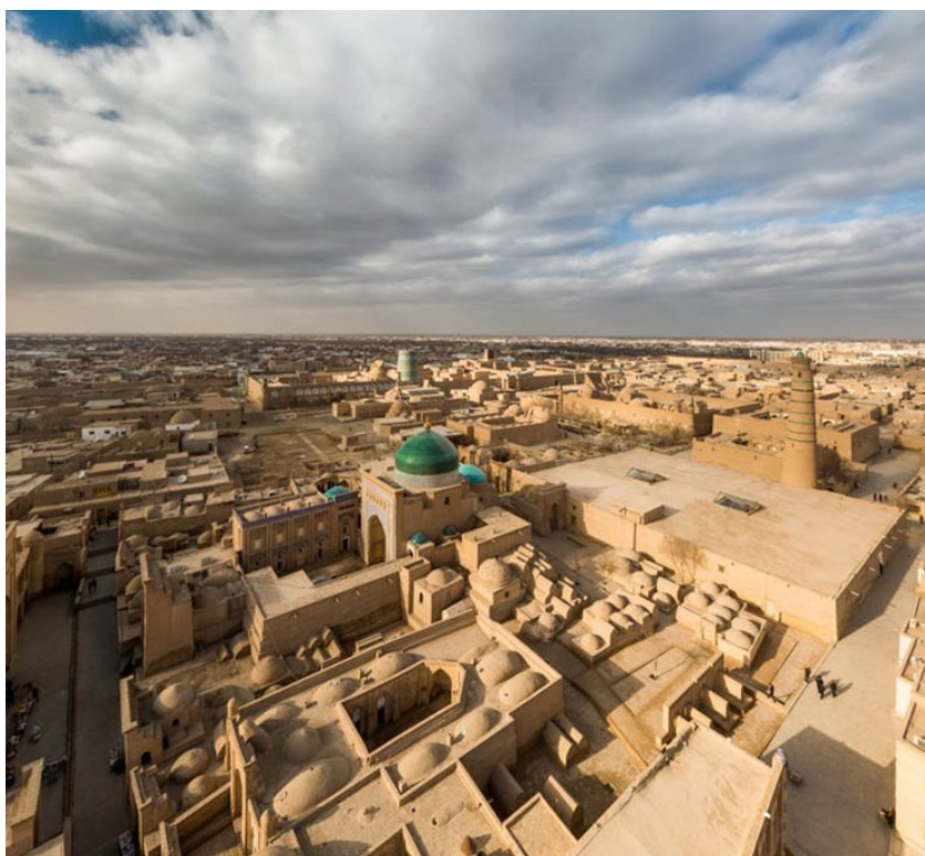
3-rasm: Ichan-Qal'a shahar to'qimasining panoramali ko'rinishi

Ilk o'rta asrlardan boshlab Xiva shahar tuzilmasida ark, shahriston va rabod kabi an'anaviy qismlar shakllanganini ko'rish mumkin. Ark hukmdor hokimiyati va boshqaruv markazi, shahriston ichki hayot va diniy-ma'muriy muhit, rabod esa hunarmandlar, savdogarlar va tashqi iqtisodiy aloqalar maydoni vazifasini bajargan [1] . Bu uchlik keyingi davrlarda Ichan-Qal'a va Dishan-Qal'a shaklida yanada aniq ko'rinish oldi.