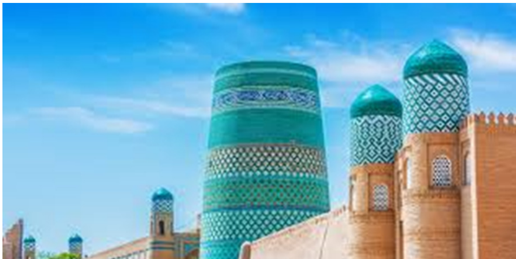
6-rasm: Xiva koshinkorligida moviy-yashil ranglar uyg'unligi

5-rasmda Kalta Minorning asosiy badiiy kuchi uning balandligida emas, balki yuzasini qoplagan rang-barang koshinlarida ko'rinadi. Feruza, to'q ko'k, oq va yashil ranglarning almashib kelishi minoraga harakat hissini beradi. Issiq sahro iqlimida bu ranglar ko'zga salqinlik baxsh etadi, shahar muhitiga esa tantanavorlik kiritadi. Xiva koshinkorligi Samarqand yoki Buxorodagi ulkan peshtoqli kompozitsiyalardan farqli ravishda, ko'pincha yaqin masofadan ko'riladigan nozik naqsh va rang muvozanatiga tayanadi. Bu yerda moviy-yashil ohanglar, geometrik ritm, o'simliksimon naqshlar hamda yozuv elementlari binoning umumiy hajmi bilan uyg'unlashib ketadi [2] . Natijada bezak devorni bosib ketmaydi, aksincha, uning yuzasini jonlantiradi.